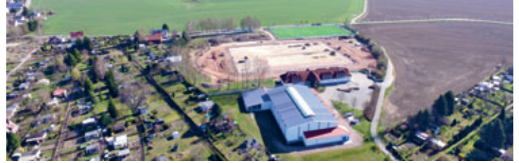
(stammt aus dem Jahr 2019)

Die Stadt Hainichen bietet ab sofort kommunale Grünflächen zur Gewinnung von Tierfutter an. Die Flächen können je nach Eignung zum Weiden oder Mähen genutzt werden. Ziel ist es, vorhandene Grünflächen sinnvoll zu nutzen und gleichzeitig die Pflege der Flächen sicherzustellen.