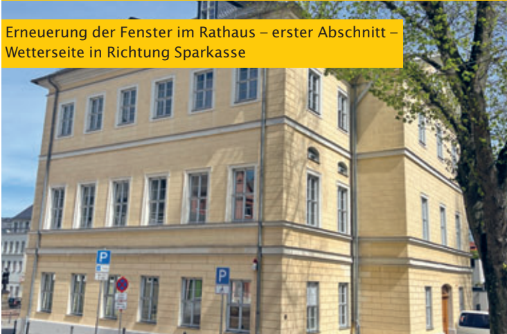
Erneuerung der Fenster im Rathaus – erster Abschnitt – Wetterseite in Richtung Sparkasse

Jahrgang 36 ● Sonnabend, 16. Mai 2026 ● Nummer 8