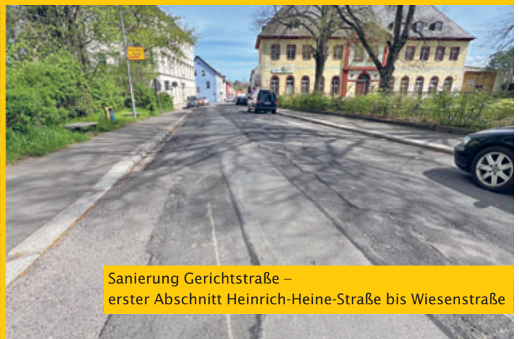
Sanierung Gerichtstraße – erster Abschnitt Heinrich-Heine-Straße bis Wiesenstraße