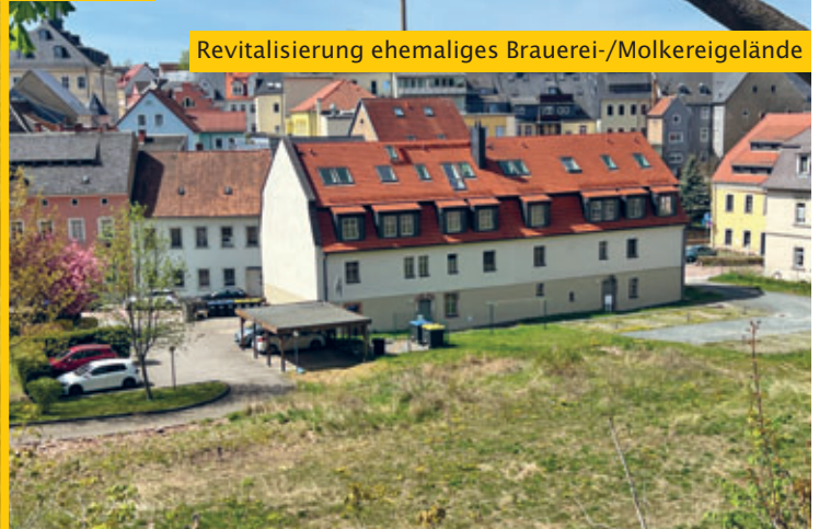
Revitalisierung ehemaliges Brauerei-/Molkereigelände