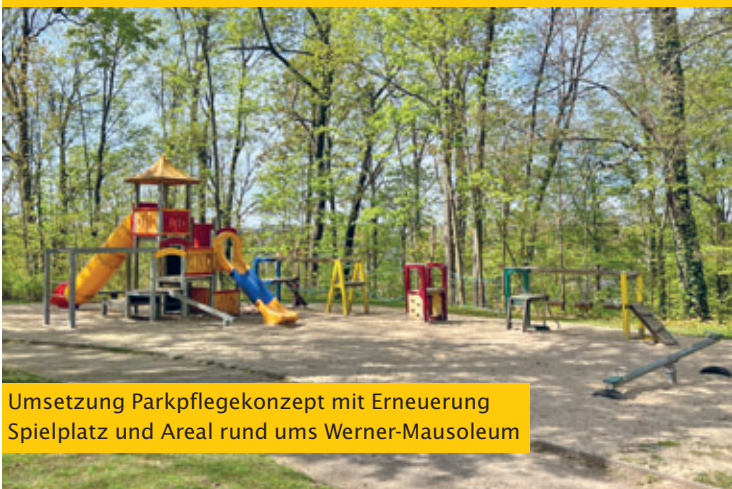
Umsetzung Parkpflegekonzept mit Erneuerung Spielplatz und Areal rund ums Werner-Mausoleum