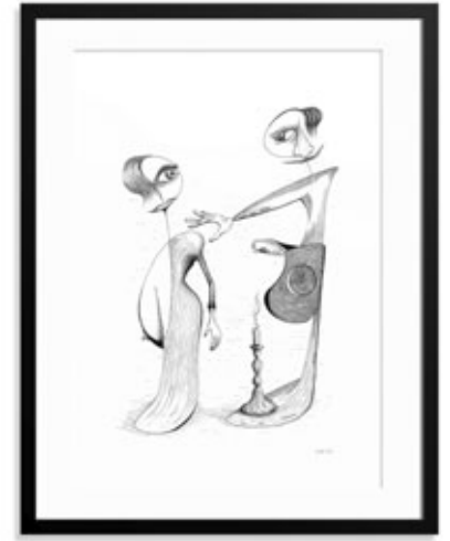
Der Mann, die Frau und der Dieb“ – eine Interpretation zur Fabel Jean de La Fontaines, Fineliner auf 120 g Zeichenpapier, DIN A3, 2024

Lorenz: Das ist bei manchen Werken schwie-