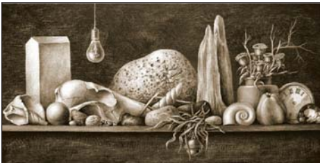
Abb. Fundus. Radierung